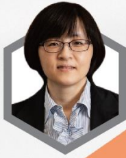
劉越萍 司長 衛生福利部醫事司