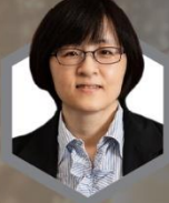
劉越萍 司長 衛生福利部醫事司